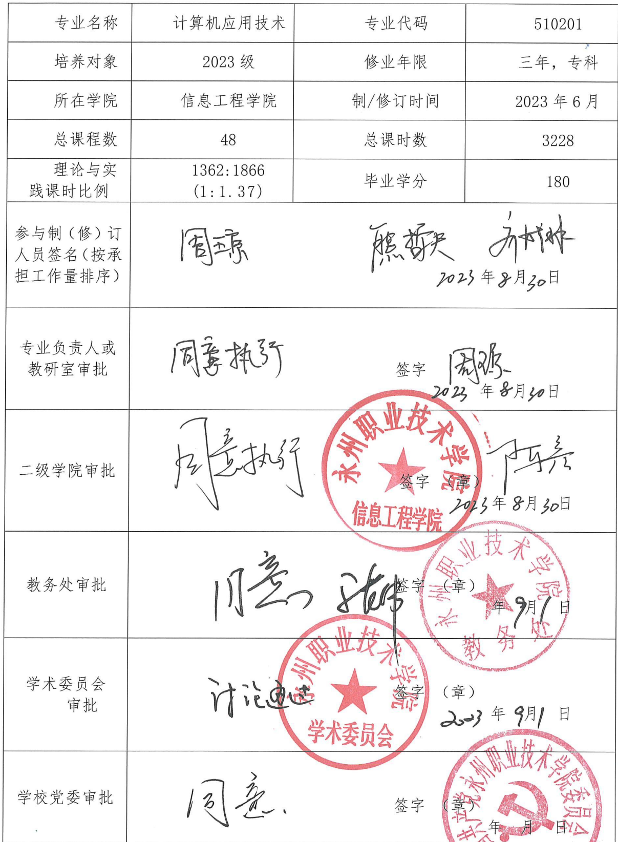
2023 级（版）人才培养方案制（修）订审核意见表